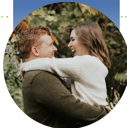
Imagen de archivo. No son pacientes reales

Esta es una captura de pantalla de la aplicación Care+